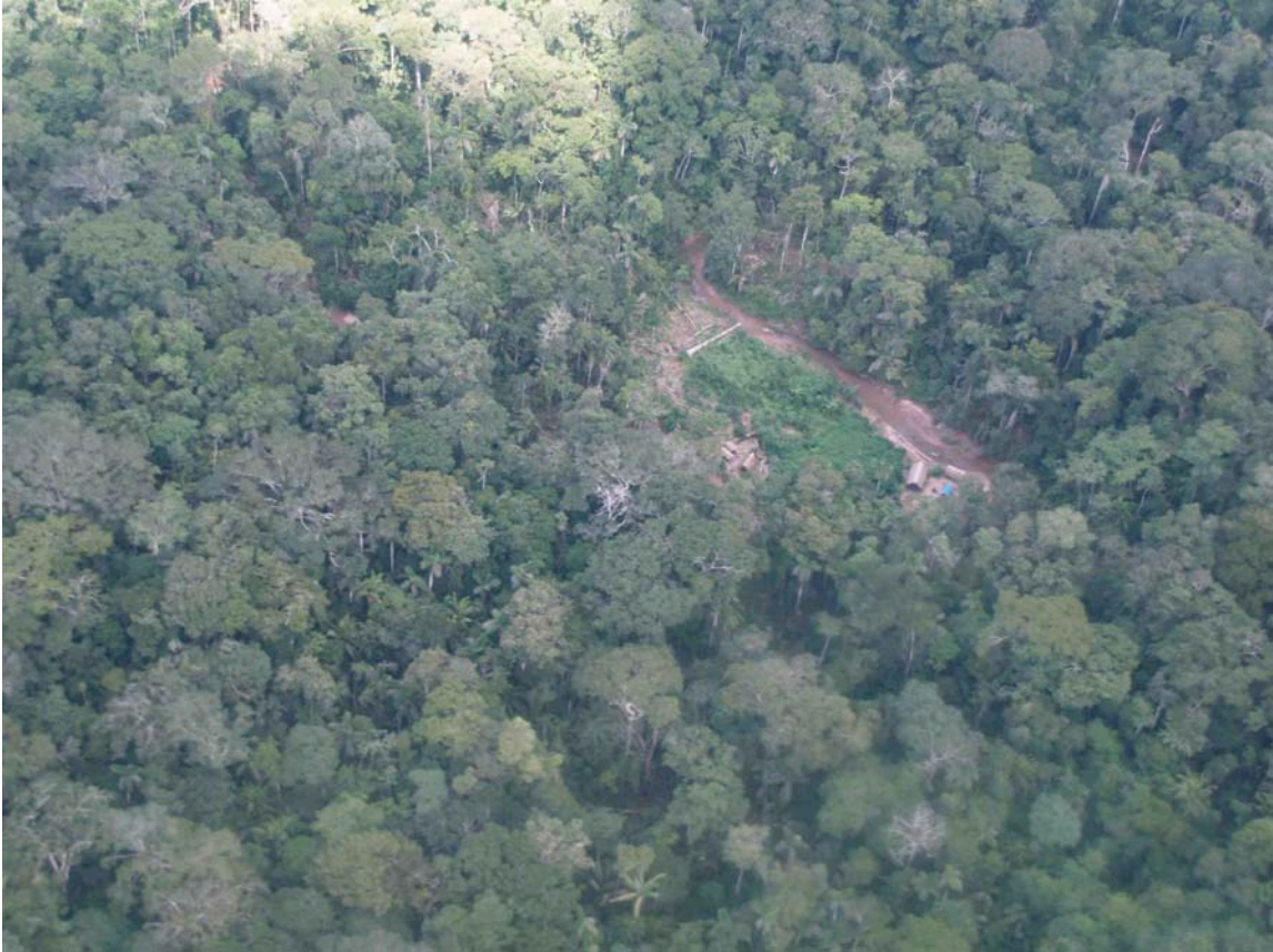
Un campamento maderero en el interior de la Reserva Territorial Murunahua cerca del límite del Parque Nacional Alto Purús (Fotos Chris Fagan 3/09)